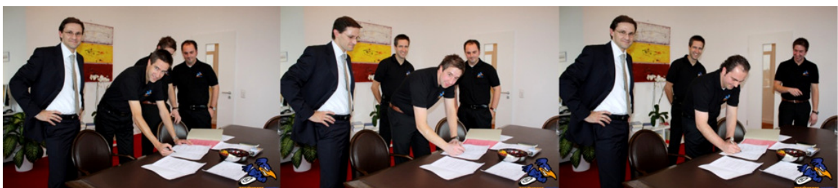
Bild 5: Unterzeichnung des Gesellschaftervertrages in Aachen bei Notar Dr. Thomas Förl